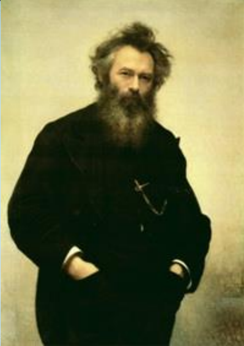
Шишкин Иван Иванович Григорий Ивановичтин үредүчизи