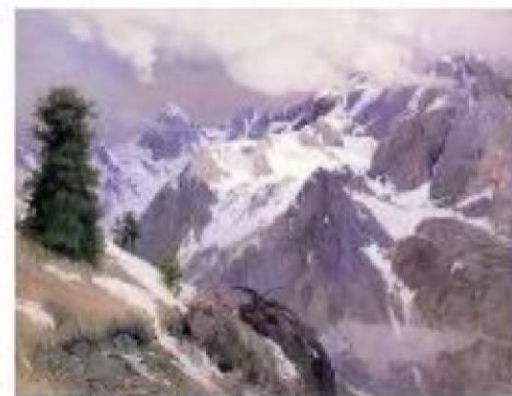
Г.Гуркин Хан- Алтай