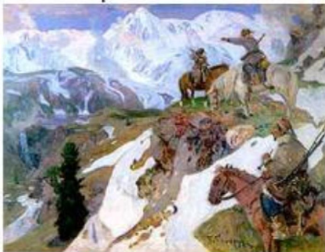
Алтайцы- охотники в горах