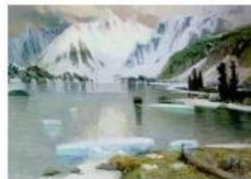
Г.Гуркин Озеро горных духов